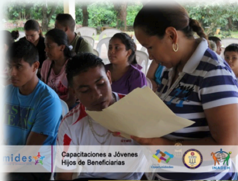
mides Capacitaciones a Jóvenes Hijos de Beneficiarias