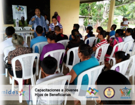
mides Capacitaciones a Jóvenes Hijos de Beneficiarias